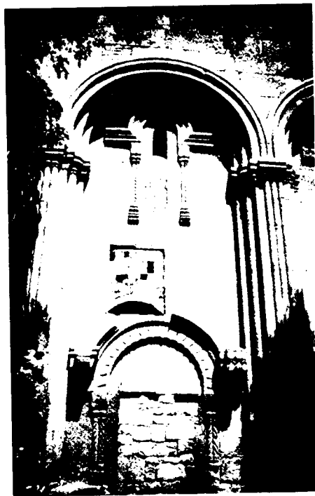
6. Собор 1032 г. в Ишхане, фрагмент южной стены.

В эпоху Багратидов зодчие анийской школы продолжили развитие аркатуры в рамках предшествующей тектонической системы. Несколько изменились вытянувшиеся кверху пропорции, появились новые типы баз и капителей. Приобрели слегка