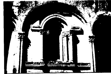
3. Главная церковь монастыря Мармашен, фрагмент аркатуры южной стены.

ки отстоят от Двина (начало 640-х гг.) 12 и Звартноца (642 – 662) 13 настолько, что не приходится и думать о переносе ее форм мигрировавшими в Армению мастерами. Однако, эти образцы могли быть знакомы самим армянским зодчим. И все же предпочтительнее представляется другой вариант развития. Генетически все эти памятники могли параллельно восходить к одной из наиболее почитаемых раннехристианских святынь. Версии о возникновении композиции Звартноца под влиянием Ротонды Воскресения в Иерусалиме (восстанавливалась в VII в.), 14 а композиции Двина под влиянием структуры церкви Рождества в Вифлееме (после перестройки императором Юстинианом в VI в.) 15 позволяет сузить поиск истоков аркатуры в пределах Палестины. Примечательно, что истоки композиции другого памятника – Ротонды Сан-Стефано в Больонье, с которым связано распространение аркатуры в Италии, тоже усматриваются в Ротонде Воскресения. 16