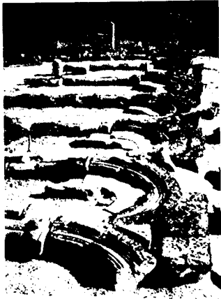
1. Храм Звартноц, фрагменты аркатуры нижнего яруса, собранные реставраторами.

существовали в Северной Сирии, где на приставленные к стене круглые колонны опирались не арки, а фриз с небольшими, взаимно удаленными конхами. Таковы колоннады алтарей церквей Калат Семана, Турманина, Калб Лозе и др. монастырей второй половины V – первой половины VI вв. 4 Близкое решение с мраморными колоннами, вероятно, существовало в раннем варианте базилики Ахейропоеос в Фесалонниках (450-470-х гг.), что позволило Содини поднять вопрос о влиянии архитектуры известнякового массива Сирии на архитектуру этой церкви. 5 Однако и пристроенный при императоре Феодосии I в 390 г. алтарь Ротонды в Фесалонниках мог содержать оформление мраморными колоннами. 6 Сохранившиеся образцы свидетельствуют о живом интересе к подобной теме декора во всем восточнохристианском мире, но с художественной и конструктивной точек зрения они значительно отличаются от армянских примеров. Так, тема аркатуры активно развивалась в раннехристианской и ранневизантийской пластике, имитирующей архитектурные образы. Примерами могут служить римский серебряный парец конца IV в. или надгробный рельеф VI в. из Константинополя, напоминающий сторону саркофага. 8 Чисто аркатурный декор армянских памятников имеет подобие в киликийско-исаврийском регионе Малой Азии. Это оформление апсиды базилики в Флабиосе (Кадирли) начала VI в. 9 Тут, как и в армянских образцах, опорами пристенных арок служат парные полуколонки, рельефно выступающие из стены однородного камня.