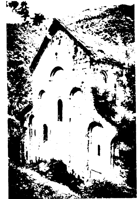
4. Главная церковь в Дорт-килисе, вид с северо-востока.

Во второй половине VII в. аркатура, восходящая к двинской или звартноцевской, применялась на ряде армянских построек, причем как на граненых участках основного объема (соборы Талина и Артика), так и на барабанах (тот же собор Талина, а также в Сисаване, Воскепаре, Хневанке и, возможно, в Аруче). Широкая география памятников и многочисленность образцов свидетельствуют о распрост-