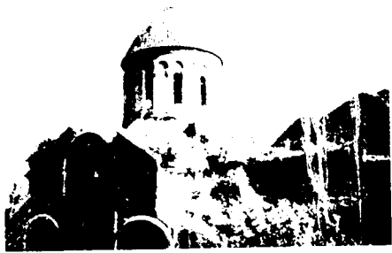
5. Ошк-ванк, общий вид собора.

раненности этого художественного приема в постзвартноцевском зодчестве. Единого направления в развитии аркатуры не улавливается, хотя очевидны постепенное упрощение форм, схематизация профилей арок или их орнаментов. Вместе с тем, появились некоторые нововведения. Так, например, на Хневанкской церкви восемь антрвольтов поочередно занимают большие человеческие головы и пальметты. Головы эти, плохо сохранившиеся, вероятно, являлись образами евангелистов, к чему склоняет не только их число, но и присутствие